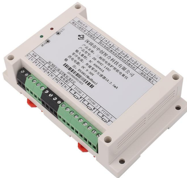
图一、产品实物图（导轨安装或螺钉）

外观尺寸：145X90X40 mm，螺钉安装尺寸,135X70mm，安装孔径 \phi 5mm