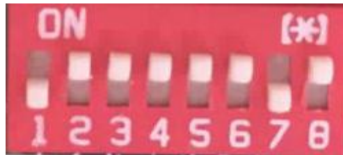
附 1: 地址码对照表

代码定义: 0--115200bps 1--9600bps 2--19200bps 3--38400bps